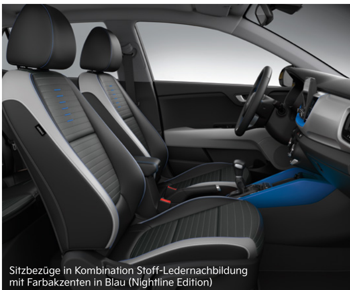
Sitzbezüge in Kombination Stoff-Ledernachbildung mit Farbakzenten in Blau (Nightline Edition)