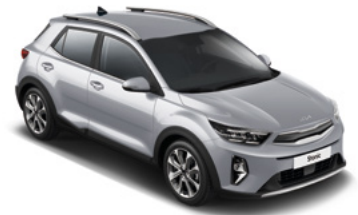
Sparklingsilber Met. (KCS)