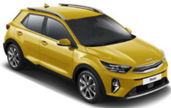
Honey Bee Yellow Met. (B2Y)