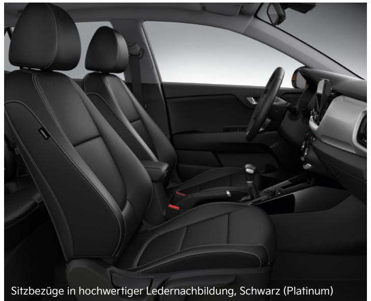
Sitzbezüge in hochwertiger Ledernachbildung, Schwarz (Platinum)