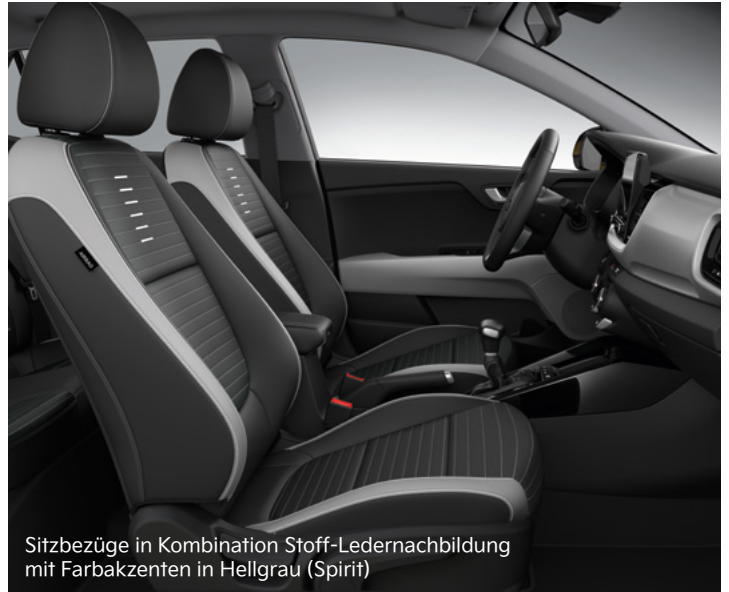
Sitzbezüge in Kombination Stoff-Ledernachbildung mit Farbakzenten in Hellgrau (Spirit)