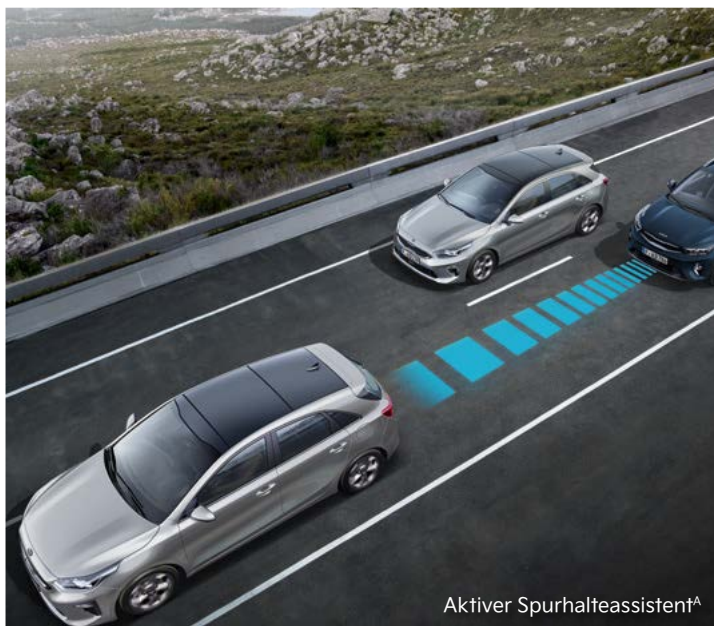
Aktiver Spurhalteassistent A

Im Kia Stonic kannst du dich rundum sicher fühlen: Moderne Assistenzsysteme A unterstützen dich dabei, in Gefahrensituationen schnell und angemessen zu reagieren. Hier siehst du einen Auszug. Ausführliche Informationen zu den Assistenzsystemen erhältst du in der Broschüre des Kia Stonic unter www.kia.com/de/broschuere .