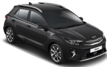
Auroraschwarz Met. (ABP)