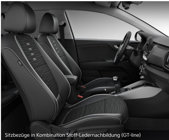
Sitzbezüge in Kombination Stoff-Ledernachbildung (GT-line)