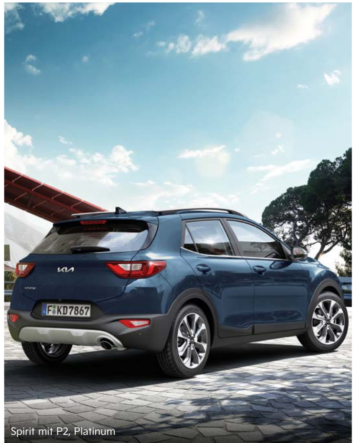
Spirit mit P2, Platinum