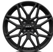
17-Zoll-Leichtmetallfelgen (Nightline Edition)