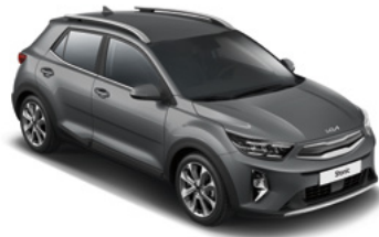
Astrograu Met. (M7G)