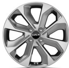
17-Zoll-Leichtmetallfelgen (Spirit und Platinum)