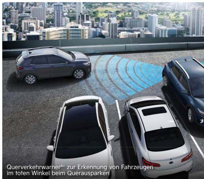
Querverkehrswarner A+ zur Erkennung von Fahrzeugen im toten Winkel beim Querausparken