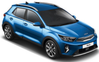
Bathysblau Met. (SPB)