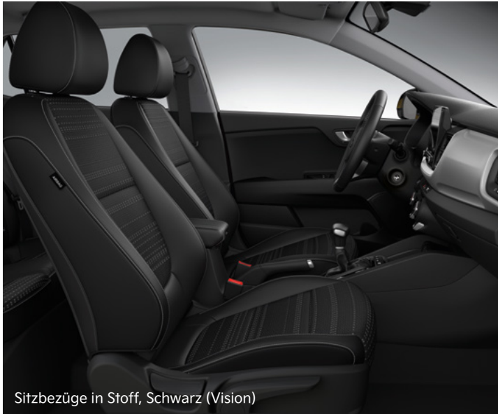
Sitzbezüge in Stoff, Schwarz (Vision)

Hier kannst du dich entspannen: Für den Kia Stonic stehen Sitzbezüge aus Stoff oder Stoff in Kombination mit Ledernachbildung zur Wahl. Die Version Platinum bietet dir Sitze aus hochwertiger Ledernachbildung.