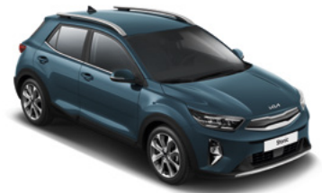
Denimblau Met. (EU3)