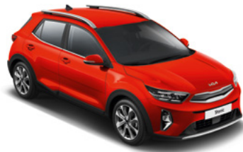
Signalrot Met. (BEG)