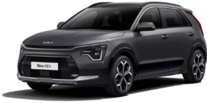
Interstellar Grau Metallic (AGT)