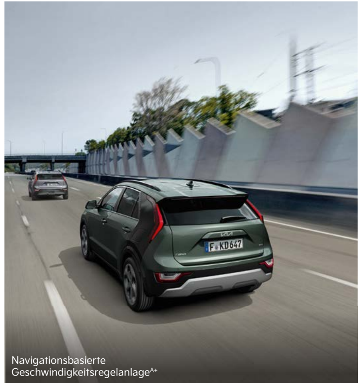
Navigationsbasierte Geschwindigkeitsregelanlage A+

Zusätzliche Sicherheit beim Zurücksetzen aus Parklücken oder langsamem Manövrieren im Rückwärtsgang: Der Kollisionsvermeidungsassistent (Parking Collision-Avoidance Assist, PCA) registriert mit Unterstützung der Rückfahrkamera sowie der hinteren Ultraschallsensoren, ob sich Fußgänger