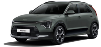
Cityscape Grün Metallic (CGE)