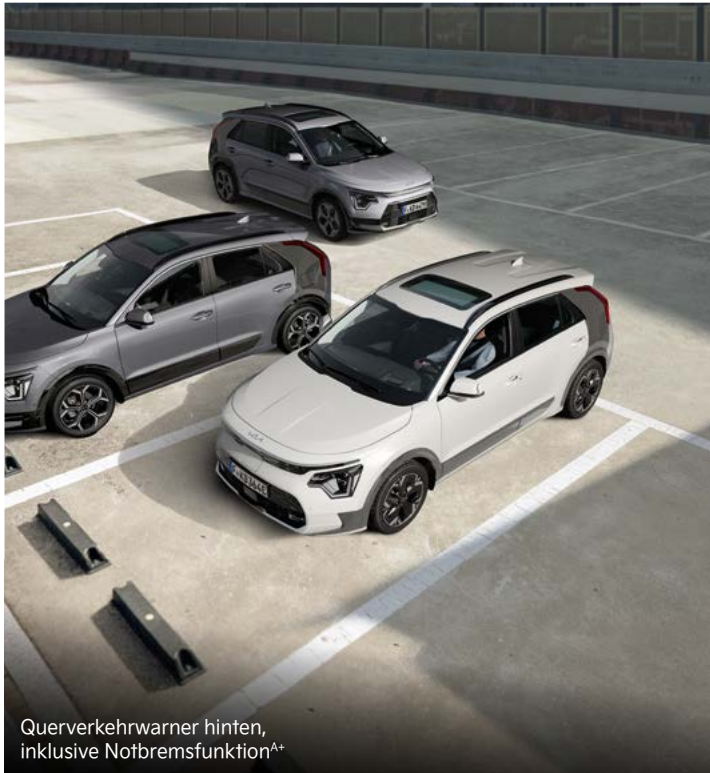
Querverkehrswarner hinten, inklusive Notbremsfunktion A+

Mit einem breiten Spektrum an aktiven Sicherheitssystemen A unterstützt dich der Kia Niro dabei, in Gefahrensituationen schnell und angemessen zu reagieren.