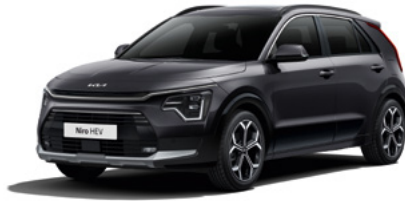
Auroraschwarz Metallic (ABP)