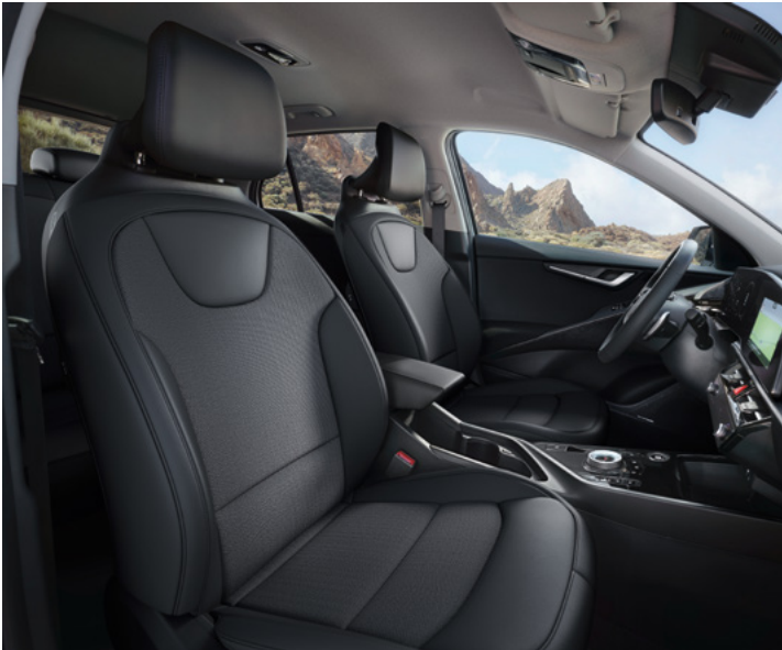
Sitzbezüge in Stoff-Leder-Kombination (mit hochwertiger Ledernachbildung), Charcoal (CCV) (Vision)