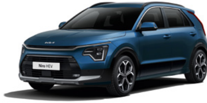
Mineralblau Metallic (M4B)