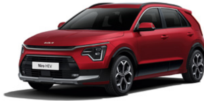
Runway Rot Metallic (CR5)

Bei einigen unserer modernen Metallicfarben werden bewusst unterschiedliche Farbpigmente verwendet. Dadurch können unter bestimmten Lichtverhältnissen, z. B. direktes Sonnenlicht, attraktive Farbeffekte erzielt werden. Zum Teil kann die Farbe changieren, z. B. von Schwarz zu Dunkelblau. Bei den hier abgebildeten Farbdarstellungen kann es aufgrund der Drucktechnik zu Abweichungen zu den Originalfarben kommen. Weitere Informationen zu den Farbeffekten und Grundfarben erhältst du bei deinem Kia-Partner. Metalllackierungen sind aufpreispflichtig.