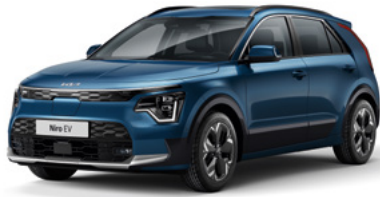
Mineralblau Metallic (M4B)