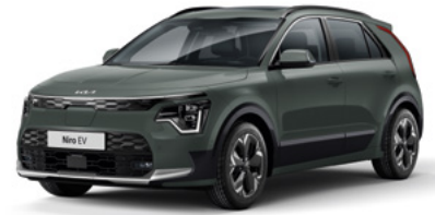
Cityscape Grün Metallic (CGE)