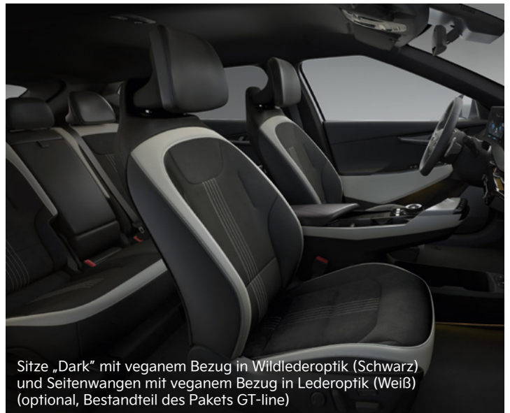
Sitze „Dark“ mit veganem Bezug in Wildlederoptik (Schwarz) und Seitenwangen mit veganem Bezug in Lederoptik (Weiß) (optional, Bestandteil des Pakets GT-line)