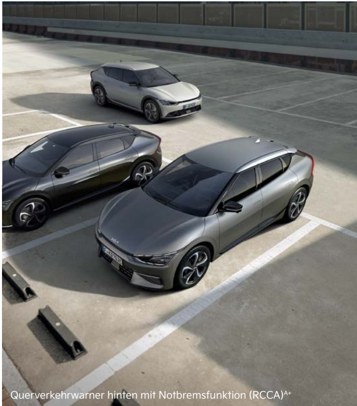
Querverkehrswarner hinten mit Notbremsfunktion (RCCA) A+

Mit einem breiten Spektrum an aktiven Sicherheitssystemen A unterstützt dich der Kia EV6 dabei, in Gefahrensituationen schnell und angemessen zu reagieren.