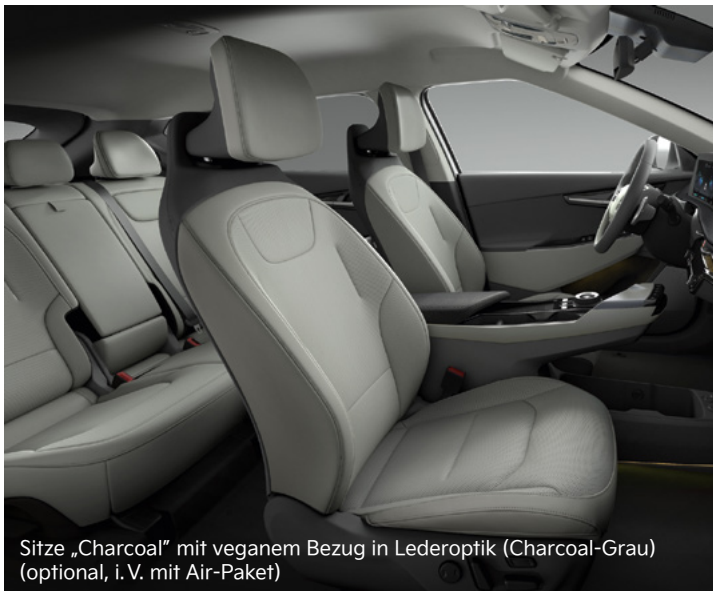
Sitze „Charcoal“ mit veganem Bezug in Lederoptik (Charcoal-Grau) (optional, i. V. mit Air-Paket)