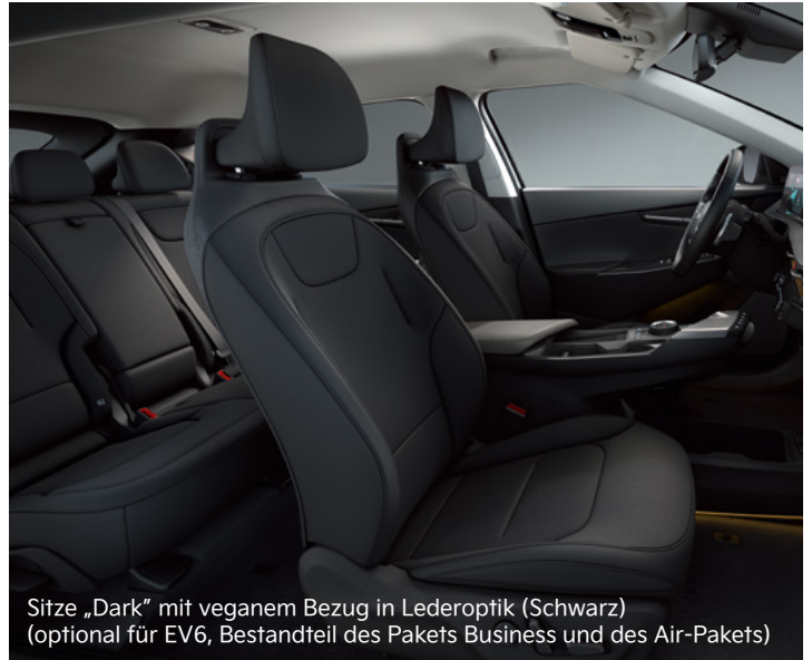
Sitze „Dark“ mit veganem Bezug in Lederoptik (Schwarz) (optional für EV6, Bestandteil des Pakets Business und des Air-Pakets)