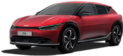
Runway Rot Metallic (CR5)

Der EV6 ist so individuell wie du. Passe ihn deinem Stil an. Denn jedes Detail zählt.