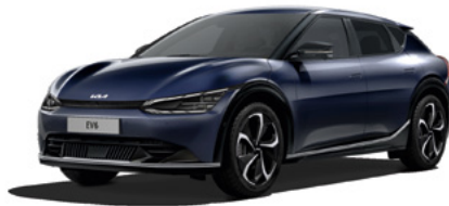
Gravity Blau Metallic (B4U)