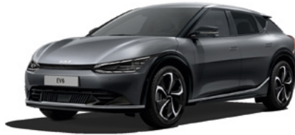
Interstellargrau Metallic (AGT)