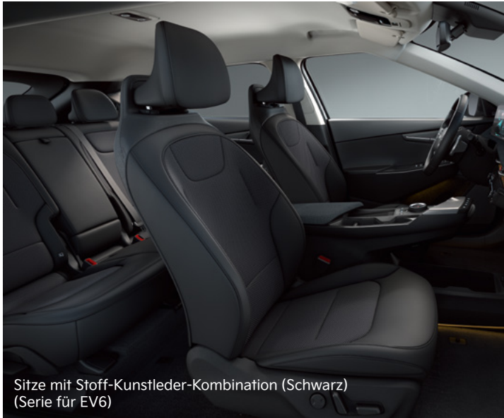
Sitze mit Stoff-Kunstleder-Kombination (Schwarz) (Serie für EV6)

Von weicher, strapazierfähiger Mikrofaser über veganes Leder bis hin zu recycelten Materialien: Die Ergonomie des Kia EV6 ist so gestaltet, dass du dich wohlfühlst.