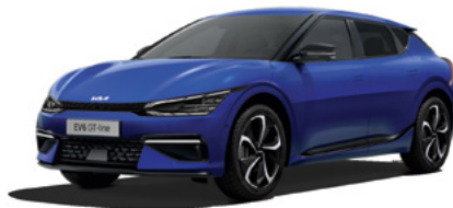
Yacht Blau Metallic (DU3)

Bei einigen unserer modernen Metallicfarben werden bewusst unterschiedliche Farbpigmente verwendet. Dadurch können unter bestimmten Lichtverhältnissen, z. B. direktes Sonnenlicht, attraktive Farbeffekte erzielt werden. Zum Teil kann die Farbe changieren, z. B. von Schwarz zu Dunkelblau. Bei den hier abgebildeten Farbdarstellungen kann es aufgrund der Drucktechnik zu Abweichungen zu den Originalfarben kommen. Weitere Informationen zu den Farbeffekten und Grundfarben erhältst du bei deinem Kia-Partner. Metalliclackierungen sind aufpreispflichtig.