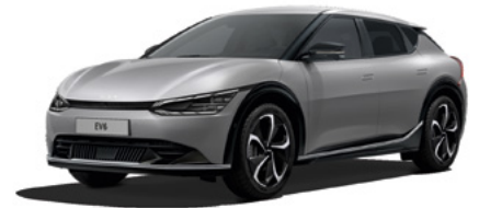
Stahlgrau Metallic (KLG)