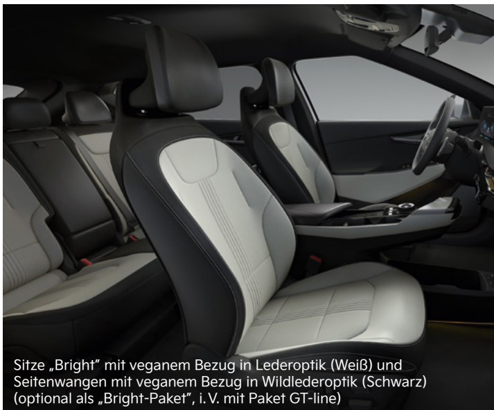
Sitze „Bright“ mit veganem Bezug in Lederoptik (Weiß) und Seitenwangen mit veganem Bezug in Wildlederoptik (Schwarz) (optional als „Bright-Paket“, i. V. mit Paket GT-line)