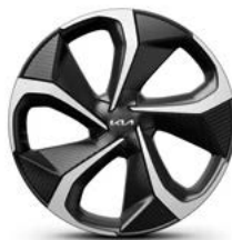
20-Zoll-Leichtmetallfelgen (in Verbindung mit Design-Paket)