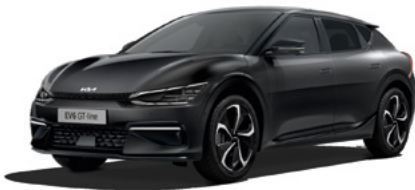
Auroraschwarz Metallic (ABP)