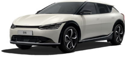
Glacier Metallic (GLB)