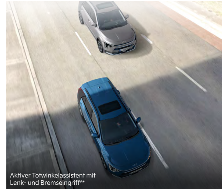
Aktiver Totwinkelassistent mit Lenk- und Bremseneingriff A+

Der serienmäßige aktive Spurhalteassistent (Lane Keep Assist, LKA) behält per Kamera ständig die Fahrbahnmarkierungen im Blick. Bei einem unbeabsichtigten Verlassen der Fahrbahn warnt es dich und lenkt zugleich geringfügig gegen, um das Fahrzeug in der Spur zu halten (ohne Abbildung).