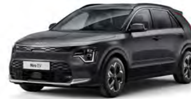
Interstellar Grau Metallic (AGT)