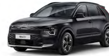
Auroraschwarz Metallic (ABP)