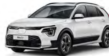
Snow White Pearl (SWP)