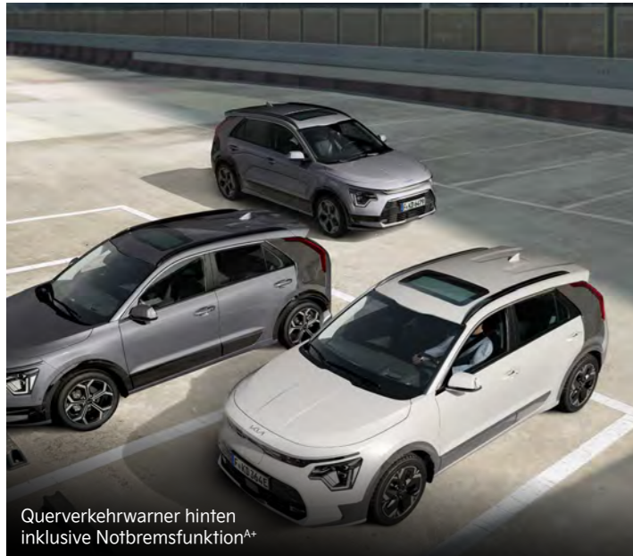
Querverkehrswarner hinten inklusive Notbremsfunktion A+

Mit einem breiten Spektrum an aktiven Sicherheitssystemen A unterstützt dich der Kia Niro dabei, in Gefahrensituationen schnell und angemessen zu reagieren.