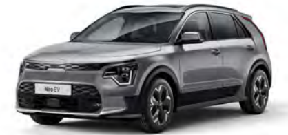
Stahlgrau Metallic (KLG)