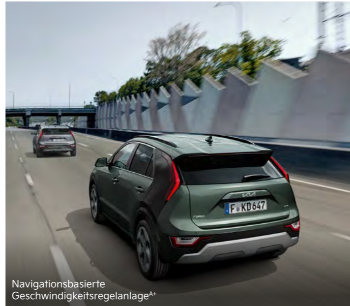
Navigationsbasierte Geschwindigkeitsregelanlage A+

Kia Niro Hybrid: Kraftstoffverbrauch in l/100 km für innerorts/außerorts/kombiniert 3,8/4,5/4,2. CO 2 -Emission in g/km (kombiniert): 97; Effizienzklasse: A+. Kia Niro Plug-in Hybrid: Kraftstoffverbrauch in l/100 km (kombiniert) 1,3; Stromverbrauch in kWh/100 km (kombiniert) 10,5. CO 2 -Emission in g/km (kombiniert): 29; Effizienzklasse: A+++.