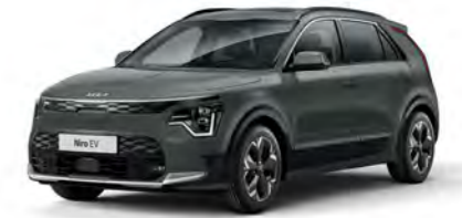
Cityscape Grün Metallic (CGE)