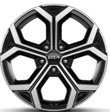
18-Zoll-Leichtmetallfelgen nur für Spirit

Bei einigen unserer modernen Metallicfarben werden bewusst unterschiedliche Farbpigmente verwendet. Dadurch können unter bestimmten Lichtverhältnissen, z.B. direktes Sonnenlicht, attraktive Farbeffekte erzielt werden. Zum Teil kann die Farbe changieren, z.B. von Schwarz zu Dunkelblau. Bei den hier abgebildeten Farbdarstellungen kann es aufgrund der Drucktechnik zu Abweichungen zu den Originalfarben kommen. Weitere Informationen zu den Farbeffekten und Grundfarben erhältst du bei deinem Kia-Partner. Metalllackierungen sind aufpreispflichtig.