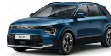
Mineralblau Metallic (M4B)