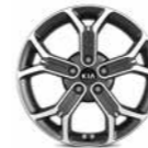
18-Zoll- Leichtmetall- felgen

Bei einigen unserer modernen Metallicfarben werden bewusst unterschiedliche Farbpigmente verwendet. Dadurch können unter bestimmten Lichtverhältnissen, z. B. direktes Sonnenlicht, attraktive Farbeffekte erzielt werden. Zum Teil kann die Farbe changieren, z. B. von Schwarz zu Dunkelblau. Bei den hier abgebildeten Farbdarstellungen kann es aufgrund der Drucktechnik zu Abweichungen zu den Originalfarben kommen. Weitere Informationen zu den Farbeffekten und Grundfarben gibt Ihnen gerne Ihr Kia-Vertragshändler. Metalliclackierungen sind aufpreispflichtig.