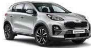
Sparklingsilber Metallic (KCS)