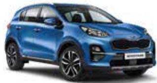
Blueflame Metallic (B3L)