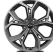
19 Zoll „GT Line“ mit Bereifung 245/45 R19 (Serie in GT Line)

Detaillierte Informationen zum Kia Sportage finden Sie unter www.kia.com/de/broschuere Dort können Sie sich auch die komplette Modellbroschüre herunterladen.