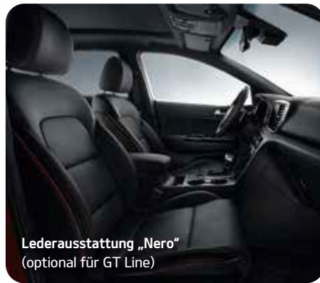
Lederausstattung „Nero“ (optional für GT Line)