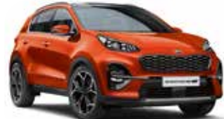
Orange Fusion Metallic (RNG), nur für GT Line

Bei einigen unserer modernen Metallicfarben werden bewusst unterschiedliche Farbpigmente verwendet. Dadurch können unter bestimmten Lichtverhältnissen, z. B. direktes Sonnenlicht, attraktive Farbeffekte erzielt werden. Zum Teil kann die Farbe changieren, z. B. von Schwarz zu Dunkelblau.