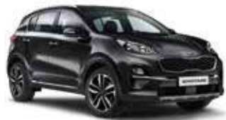
Zilinaschwarz Metallic (1K)