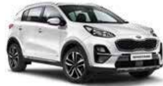
Deluxeweiß Metallic (HW2)