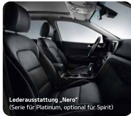
Lederausstattung „Nero“ (Serie für Platinum, optional für Spirit)