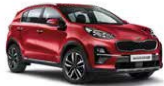
Infrarot Metallic (AA9)