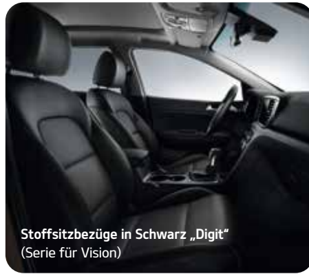
Stoffsitzbezüge in Schwarz „Digit“ (Serie für Vision)