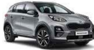
Lunarsilber Metallic (CSS)