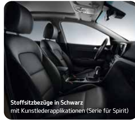
Stoffsitzbezüge in Schwarz mit Kunstlederapplikationen (Serie für Spirit)