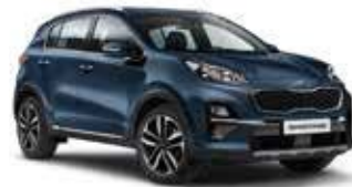
Cosmosblau Metallic (CB7)