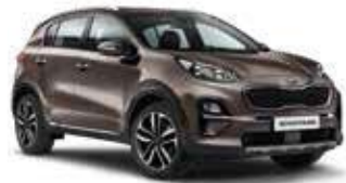
Copperstone Metallic (L2B)