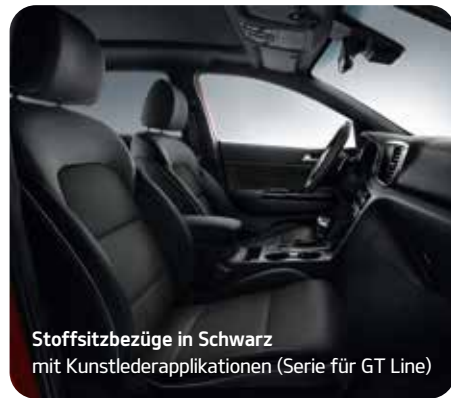
Stoffsitzbezüge in Schwarz mit Kunstlederapplikationen (Serie für GT Line)