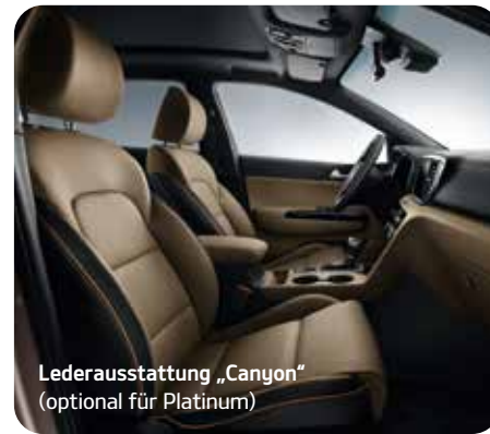
Lederausstattung „Canyon“ (optional für Platinum)