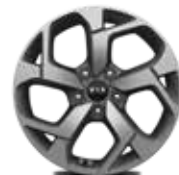
17 Zoll mit Bereifung 225/60 R17 (Serie in VISION)