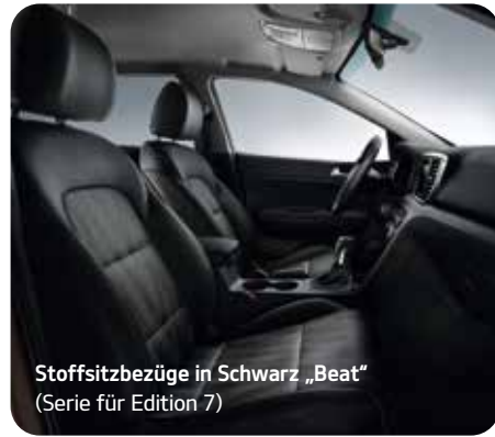
Stoffsitzbezüge in Schwarz „Beat“ (Serie für Edition 7)

Das hochwertige Interieur mit vielen Soft-Touch-Oberflächen und erstklassiger Verarbeitung ist je nach Ausführung und Sonderausstattung mit Sitzbezügen in Stoff, Stoff-Leder-Kombination oder Lederausstattung sowie in verschiedenen Farbvarianten erhältlich.