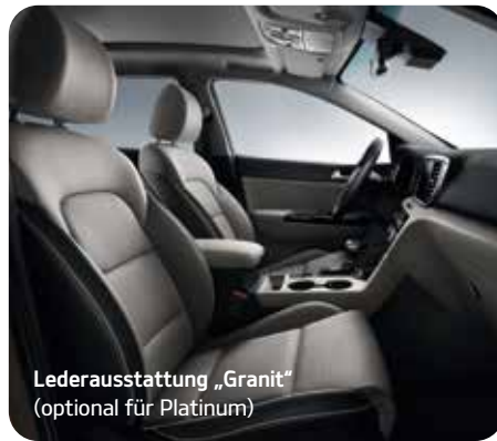
Lederausstattung „Granit“ (optional für Platinum)