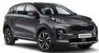
Pentametal Metallic (H8G)