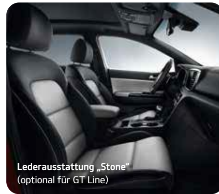
Lederausstattung „Stone“ (optional für GT Line)