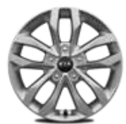
16 Zoll mit Bereifung 215/70 R16 (Serie in EDITION 7)

Bei den hier abgebildeten Farbdarstellungen kann es aufgrund der Drucktechnik zu Abweichungen zu den Originalfarben kommen. Weitere Informationen zu den Farbeffekten und Grundfarben gibt Ihnen gerne Ihr Kia-Vertragshändler. Metalliclackierungen sind aufpreispflichtig.