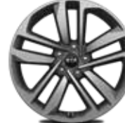
19 Zoll mit Bereifung 245/45 R19 (Serie in SPIRIT, außer 1.6 GDI, und PLATINUM)